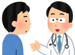
経営の早めの健康相談

経営の 早め の健康相談と考え、気をつける点を知り、改善したい習慣等の見直しに役立てます。